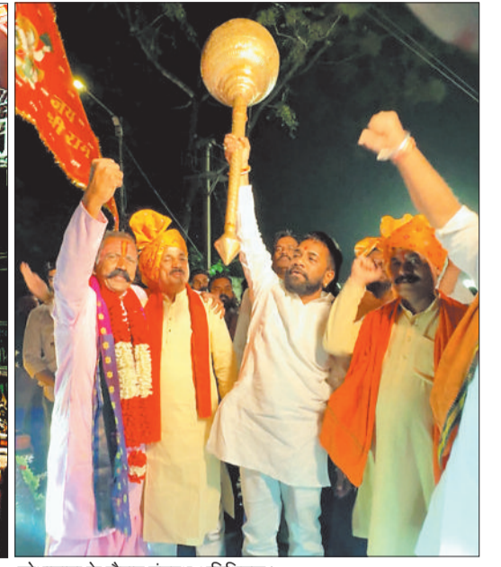
शोभायात्रा के दौरान मंत्रस्थ अतिथिगण।