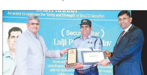
सम्मान प्राप्त करते हुए कर्मी।