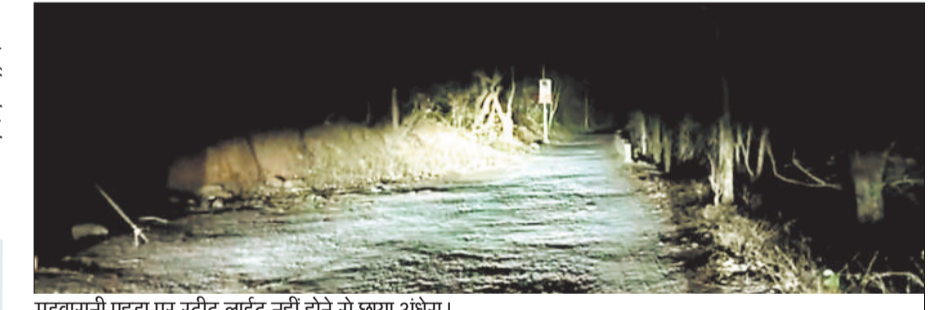
मड़वाराणी पहाड़ पर स्ट्रीट लाईट नहीं होने से छाया अंधेरा।

■ स्ट्रीट लाइट नहीं जलने से लोगों को हो रही परेशानी