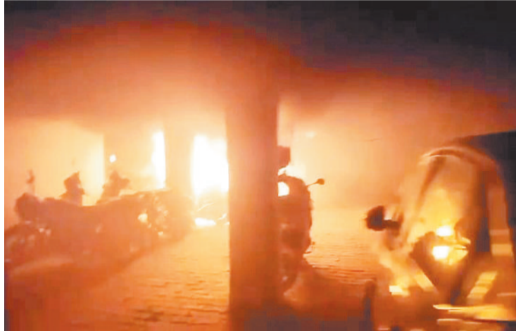
बाइक व कार में आग लगी हुई थी, गाड़ियों को जलते देख कालोनी में हड़कंप मच गया।