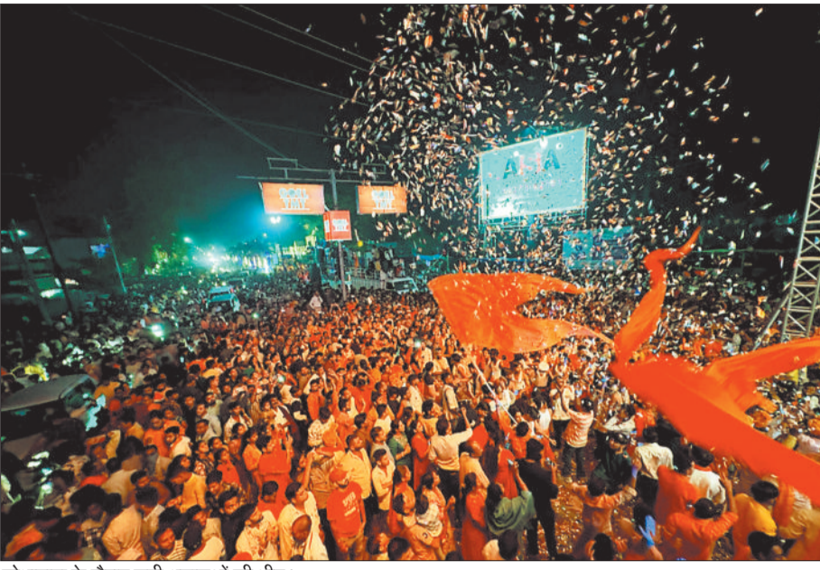
शोभायात्रा के दौरान लगी श्रद्धालुओं की भीड़।