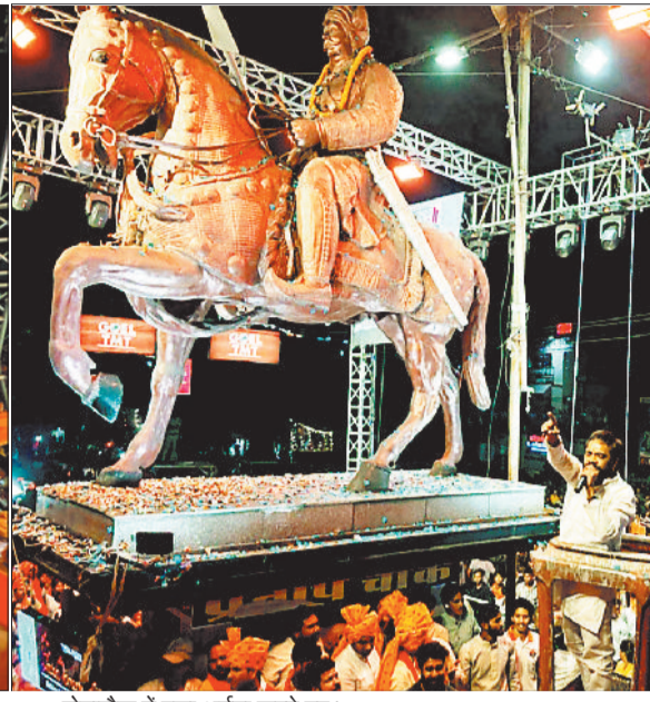
घोड़ाचौक में पूजा अर्चना करते हुए।