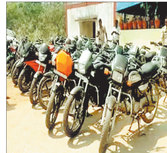
जप्त मोटर सायकल।

हिन्दू नववर्ष के अवसर पर शहर में विशाल रैली का आयोजन किया गया था लेकिन इस रैली के बहाने कुछ और सामाजिक तत्वों द्वारा अपने मोटरसाइकिलों के साइलेंसर्स को खोल दिया गया था और बेतरतीब साइलेंसर की तेज आवाज के साथ सड़कों पर फराटे भर रहे थे तो बुलेट में पटाखे की आवाज निकाल कर फराटे भर रहे थे। लगातार एस तरह की हरकतों से सड़क पर घूमने वाले लोगों को ख़ासी परेशानियों का सामना करना पड़ रहा था इसे देखते हुए पुलिस ने ऐसे लापरवाह चालकों के खिलाफ ताबड़तोड़ कार्रवाई की है। बताया जाता है सिविल लाइन पुलिस ने 25 वाहन चालकों के मोटरसाइकिल को जब्त की कार्यवाही जुर्माना वसूल किया गया है। हिंदू नववर्ष के मौके पर शहर में निकली शोभायात्रा के दौरान दुपहिया वाहनों के साइलेंसर्स को मोडीफाई कर ध्वनी प्रदूषण फैलाने वाले बाइक चालकों के खिलाफ पुलिस ने कड़ी कार्रवाई की है। पुलिस ने करीब 25 दुपहिया वाहन चालकों के