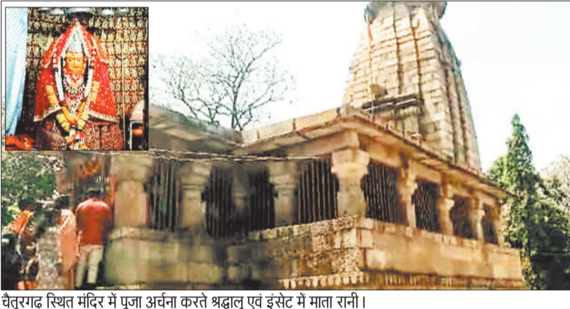
चैत्रनगढ़ स्थित मंदिर में पूजा अर्चना करते श्रद्धालु एवं इंसैट में माता रानी।

नवरात्रि का पर्व प्रारंभ होते ही माता रानी के दर्शन के लिए जिले के अलावा दूर-दूर से बड़ी संख्या में श्रद्धालु यहां पहुंचते हैं। मंदिर में विराजित माता 12 भुजा वाली हैं और आसपास हनुमान, शंकर, शनिदेव का भी मंदिर है। इसके अलावा पहाड़ के ऊपर 5 तालाब गर्गज, सुखी, केकड़ा, भूखी, सिंधी तालाब है। इसमें से 3