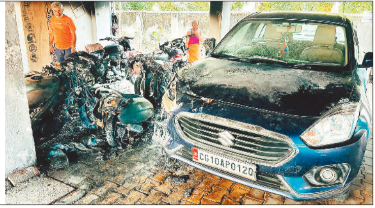
आग की चपेट में आने से 8 बाइक और एक कार जलकर राख हो गई।