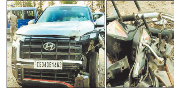
दुर्घटनाग्रस्त कार व मोपेड।