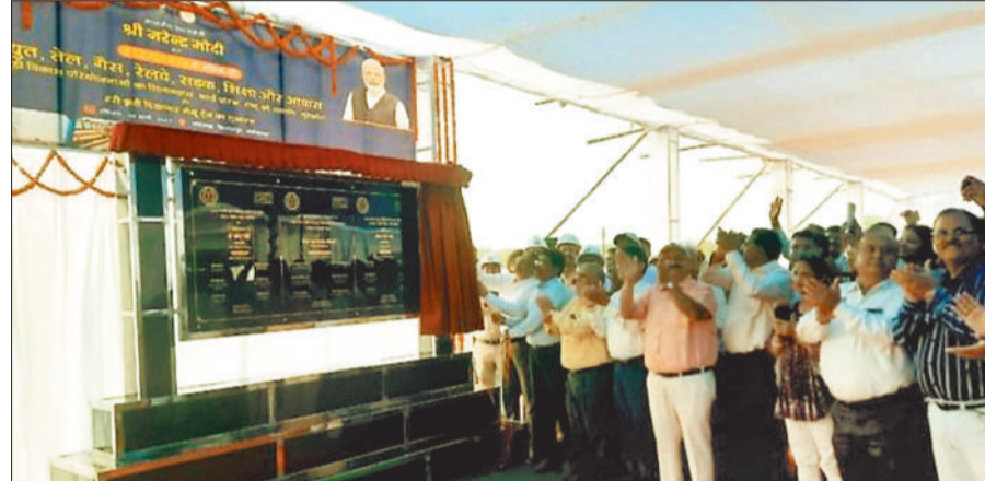
कार्यक्रम में उपस्थित अधिकारिगण।

उल्लेखनीय है कि भेल को कोरबा पश्चिम संयंत्र में 1320 मेगावाट सुपर क्रिटिकल थर्मल पावर प्रोजेक्ट बड़ा आर्डर मिला है। बीएचईएल देश की ऊर्जा सुरक्षा को सुदृढ़ करने और पावर क्षेत्र में आत्मनिर्भरता के विजन को साकार करने में एक महत्वपूर्ण भूमिका निभा रहा है। विस्तार